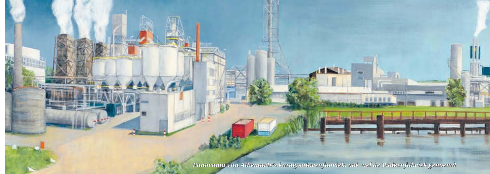
Panorama van Albemarle's katalysatorenfabriek, ook wel de Wolkenfabriek genoemd

den moeten blijven. Wat de Zamenhofstraat betreft, moeten de historische gebouwen blijven en natuurlijk de scheepshelling van Verschuren. Daar kunnen theatervoorstellingen en openluchtconcerten gehouden worden.'